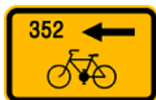
Směrová tabule vlevo