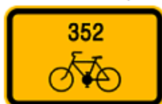
Směrová tabule přímá